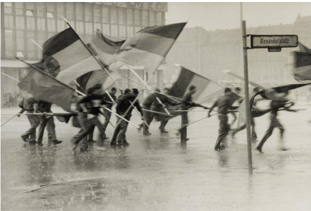
4 Harald Hauswald, 1. Mai, Alexanderplatz, Berlin 1987