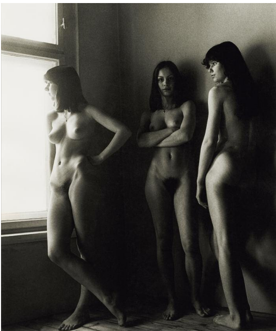
1 Günter Rössler, Drei Mädchen, Leipzig 1979 (Ausschnitt)