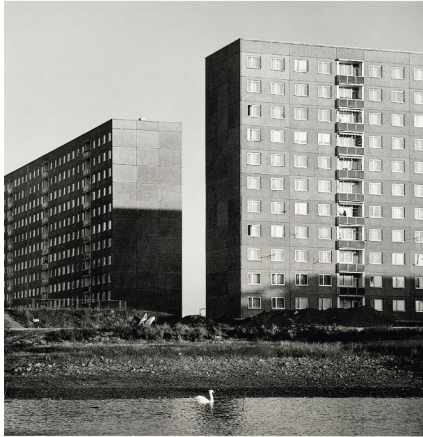
3 Thomas Steinert, Silbersee, 1977/2008