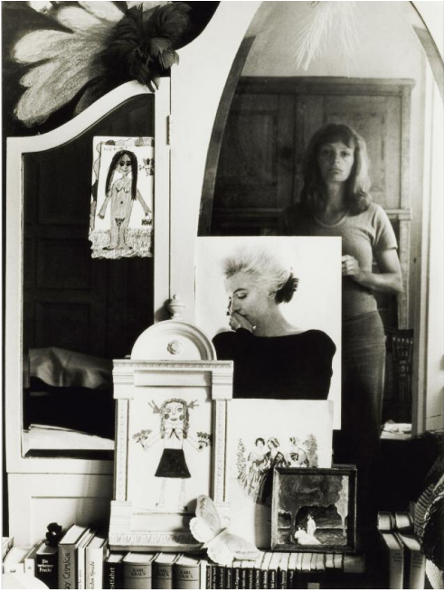
8 Helga Paris, Selbstporträt im Spiegel, 1971 (Ausschnitt)