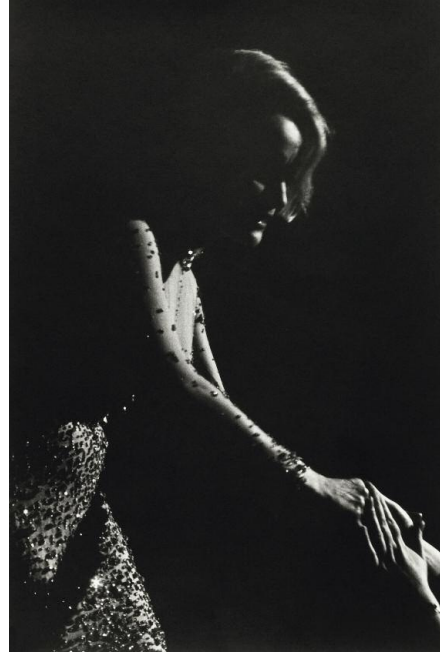
9 Arno Fischer, Marlene Dietrich, Moskau 1964